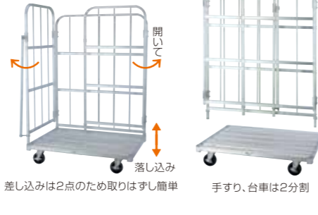
差し込みは2点のため取りはずし簡単